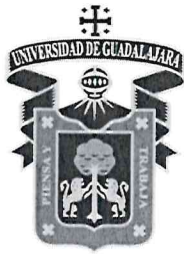
Cuadro No. 1